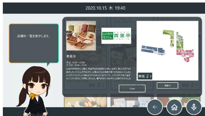
利用画面イメージ②：エスパル店舗情報