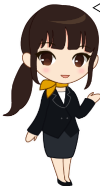
<案内キャラクター>

エスパル仙台案内キャラクターの「杜の パルミ」です。エスパルのことならなんでも聞いてください。