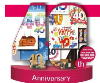
※オブジェイメージ