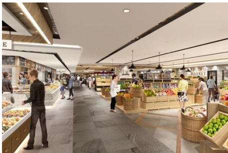
【エキチカキッチン イメージパース①】

木の温もりと上質でスタイリッシュな杜の食空間 心地よい素材感による、賑わいのあるスタイリッシュな食の空間