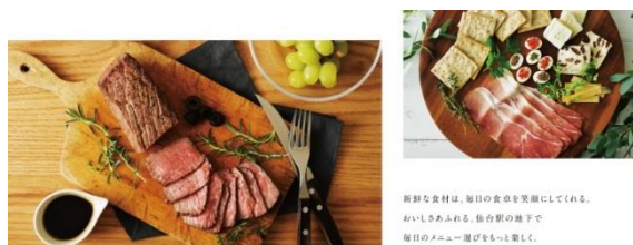
新鮮な食材は、毎日の食卓を笑顔にしてくれる。 おいしさあふれる、仙台駅の地下で 毎日のメニュー選びをもっと楽しく。

お客様のさらなる利便性向上を図り、お客様の毎日の食卓に笑顔を添えられるよう、『杜のマルシェ』をコンセプトに、駅をご利用いただくすべてのお客様へ、新鮮な食品を豊かな品揃えでエキチカから提案してまいります。