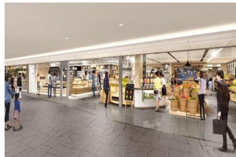
【エキチカキッチン イメージパース②】