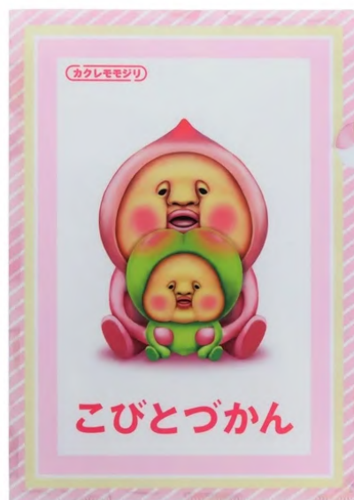
クリアファイル こびとづかん カクレモモジリ