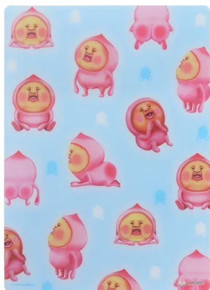
下敷 こびとづかん カクレモモジリ