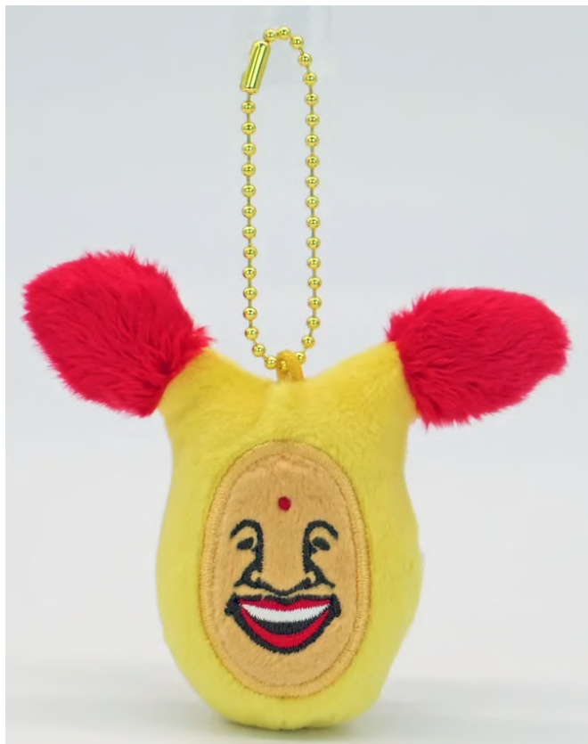
ヌイグルミバッチ ホトケアカバネ