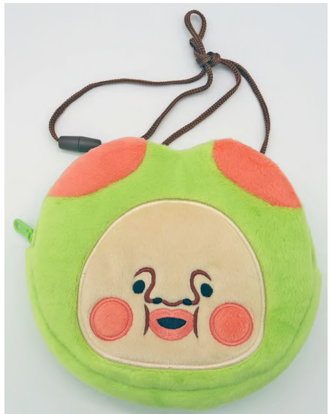
フェイスポ シェット スモノウチ