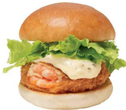
えびバーガー※画像はイメージです