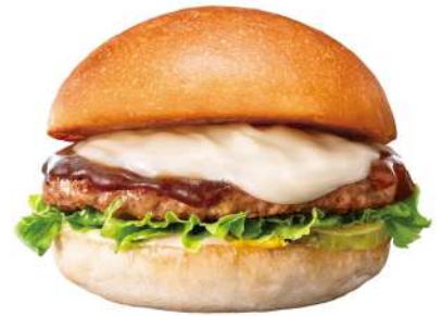
絶品チーズバーガー※画像はイメージです