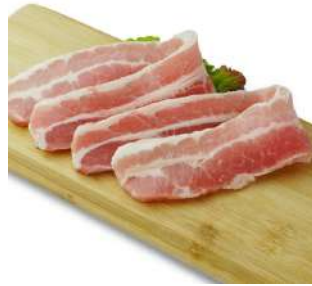
名物サムギョプサル