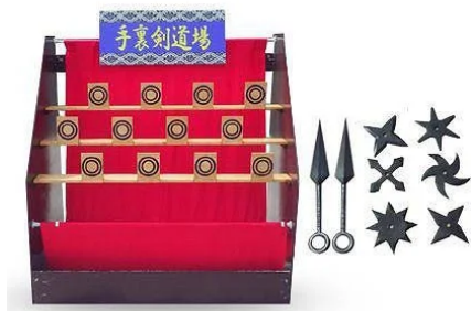
①手裏剣投げゲームイメージ