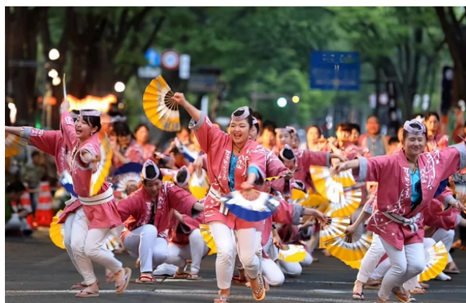
すずめ踊りイメージ

内容：仙台・青葉まつり協賛会ご協力のもと、 地元の団体がすずめ踊りを演舞いたします。