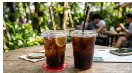
③黒いドリンク茶屋イメージ