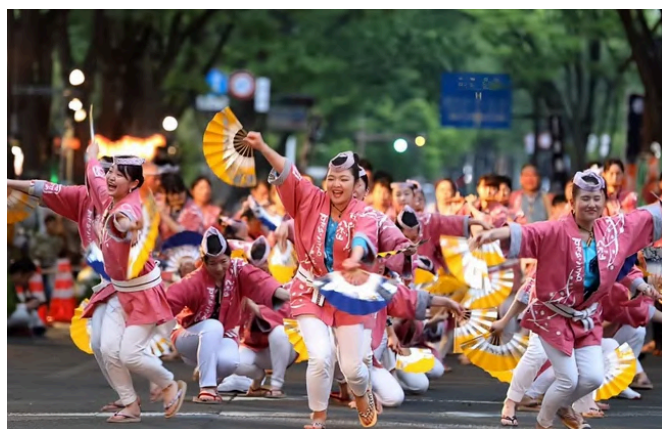
すずめ踊りイメージ

内容：仙台・青葉まつり協賛会ご協力のもと、 地元の団体がすずめ踊りを演舞いたします。