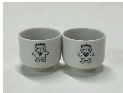
ニャンももの特製おちょこ