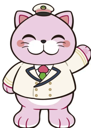
JR東日本福島エリア新キャラクター「ニャンもも」