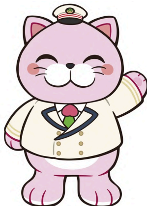
JR東日本福島エリア新キャラクター「ニャンもも」