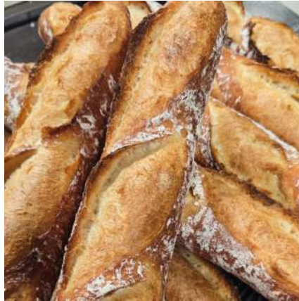
②Boulangerie Azur(ブーランジェリー アジュール):仙台市宮城野区