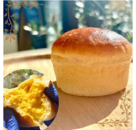
③UP!BAKER(アップベイカー):仙台市青葉区