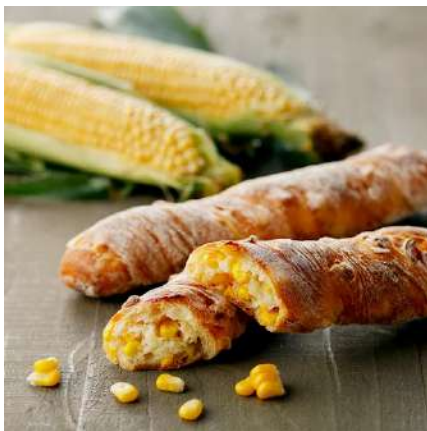
④boulangerie coron(ブーランジェリー コロン):北海道札幌市