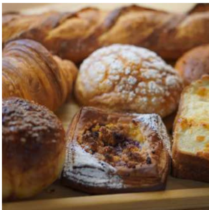
⑦三麦園:仙台市泉区