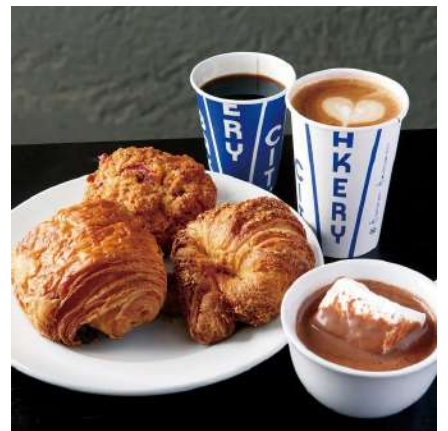
⑥THE CITY BAKERY(ザ シティベーカリー) 仙台読売青葉テラス:仙台市青葉区