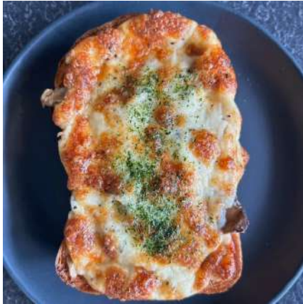
①BAKERY GOLDEN RATIO(ベーカリーゴールデンレシオ):仙台市若林区