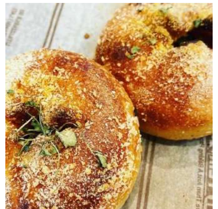
⑨あくつさんち:仙台市青葉区