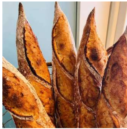
⑪THE BREAD BAR(ザ・ブレッドバー):仙台市若林区