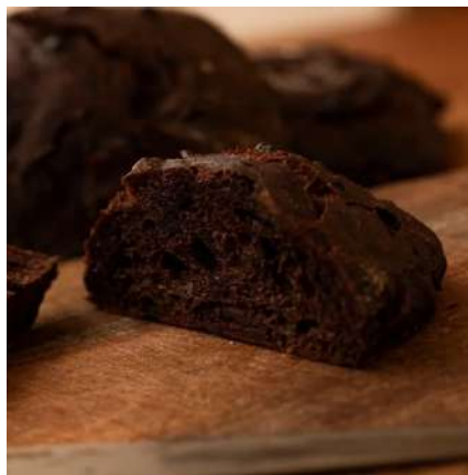
⑤パンストック 箱崎本店:福岡県福岡市