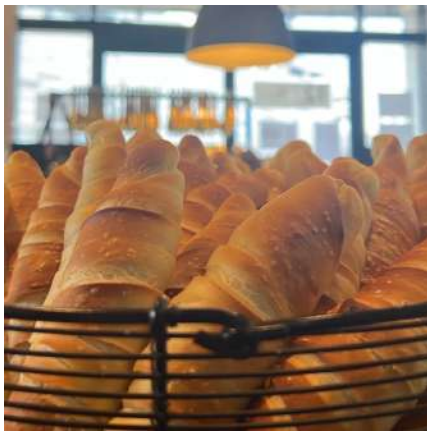
⑩ブルーランジェリージラフ:仙台市若林区 他