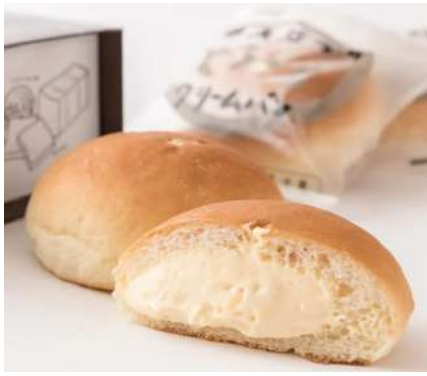
奥久慈卵のとろ〜りクリームパン