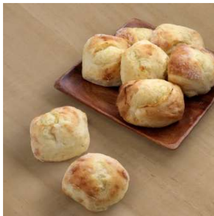
⑧満寿屋商店 麦音:北海道帯広市