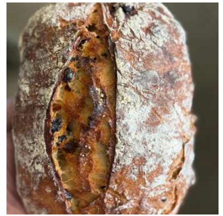
⑫ぱんやあいざわ:宮城郡松島町